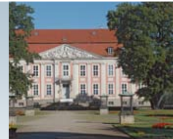
Tierpark, Schloss Friedrichsfelde

Einzelheiten zum Studienverlauf, zu Lehrveranstaltungen und Kursbelegungen sind in der Studienordnung der JUNIOR ZOO-UNIVERSITÄT BERLIN festgehalten.